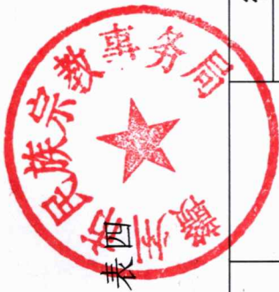
赣州市民族宗教事务局2022年度行政强制执行实施情况统计表