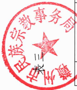
赣州市民族宗教事务局2022年度行政处罚实施情况统计表