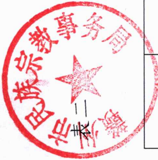
赣州市民族宗教事务局2022年度行政许可实施情况统计表